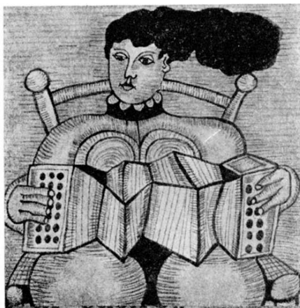
disegno di Ugo Pierri per L'Armonica (1966), n. 015

Con il marchio de Lo Zibaldone seguono una pubblicazione in collaborazione con La Editoriale libreria nel 1973 ed altre due con l'editore Marino Bolaffio nel 1975 e nel 1976.