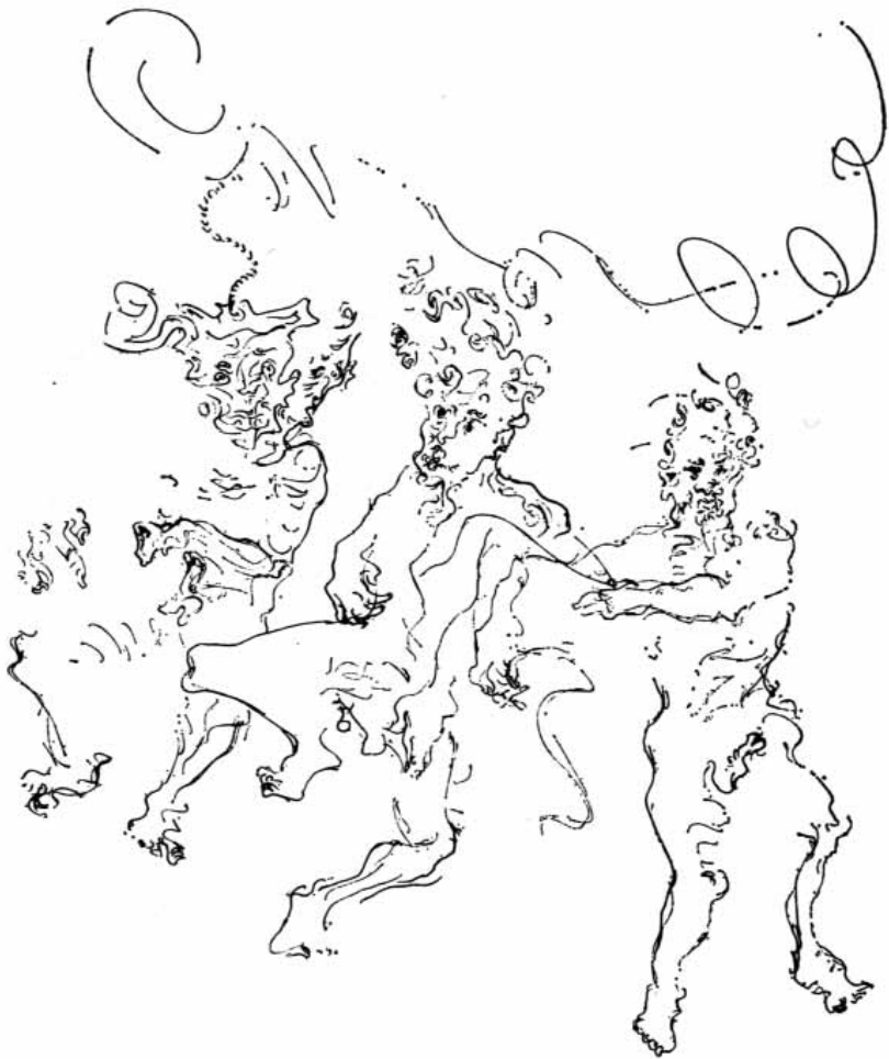
Tancredi, Senza titolo , 1961-1962